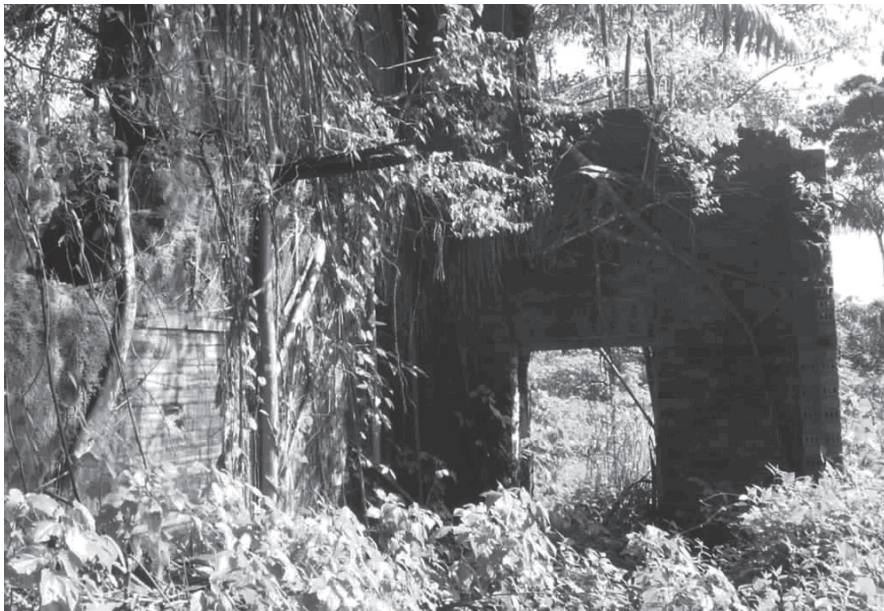
Foto da ruína do Engenho Aproaga, às margens do rio Capim, de onde negros saíram para lutar contra as tropas do governo republicano durante a Revolta do Capim, em 1891.