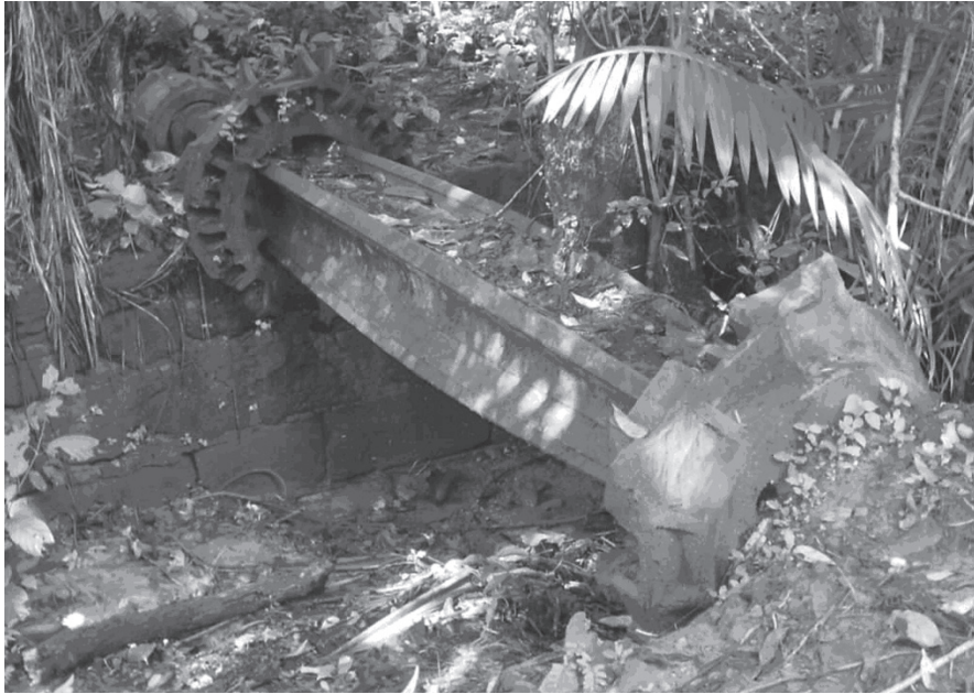
Foto do eixo da canaleta da represa do Engenho do Aproaga, de propriedade dos Chermont de Miranda.