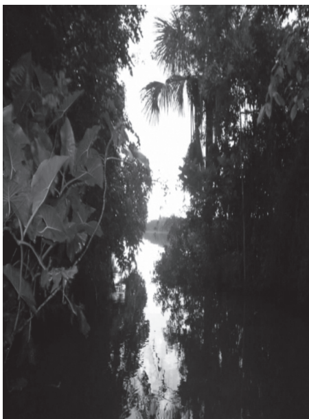
Foto atual da entrada do Igarapé Pyrajauara, onde ocorreu a luta entre o grupo de camponeses liderados por João Francisco da Luz em 1891.

Estas baixas foram apenas da tropa governista, não havendo informações de nenhuma baixa entre os revoltosos. Nem mesmo o número de revoltosos entrincheirados era do conhecimento dos oficiais da Polícia.